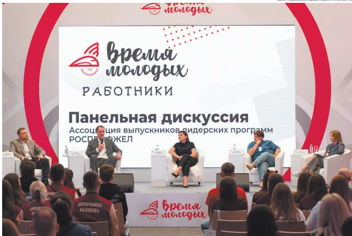
Представители Ассоциации выпускников программ РОСПРОФЖЕЛ готовы делиться опытом с более молодыми коллегами