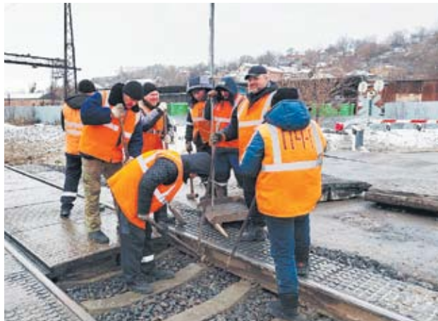
Идёт ремонт переезда на 1173 км станции Новочеркасск