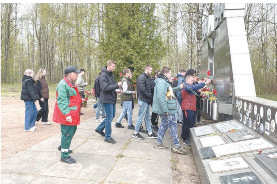
Первички Северо-Западной дирекции скоростного сообщения и Санкт-Петербургского техникума железнодорожного транспорта организовали акцию по возложению цветов к мемориалу «Синявинские высоты»