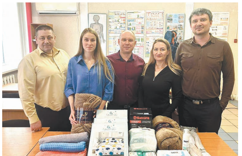
Работники Хабаровской дистанции инженерных сооружений участвовали в акции «Вагончик добра» и собрали подарки для ветеранов