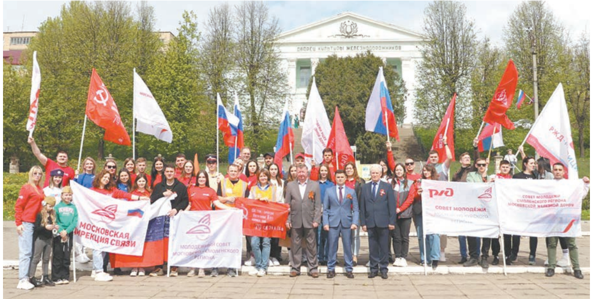
Совет молодежи МЖД организовал автопробег по местам боевой славы Смоленска и Смоленской области, посвященный 79-й годовщине Победы