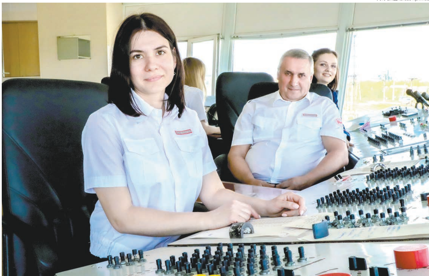
У работников есть потребность в общении с руководителями компании