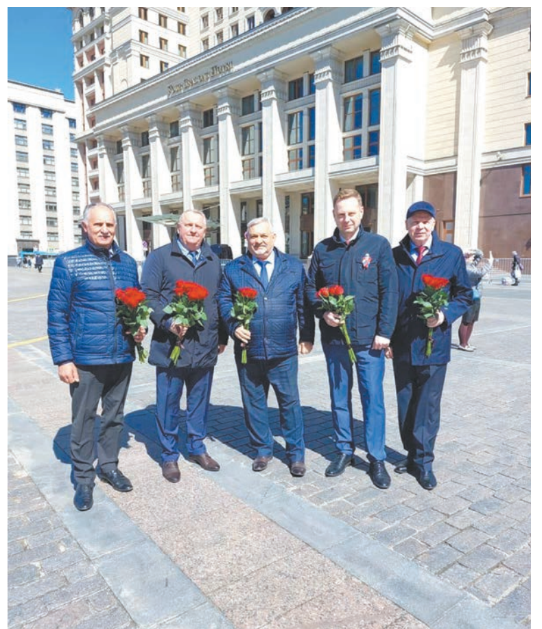
Работники транспортного комплекса почтили память воинов и возложили цветы к Вечному огню у Могилы Неизвестного Солдата в Москве