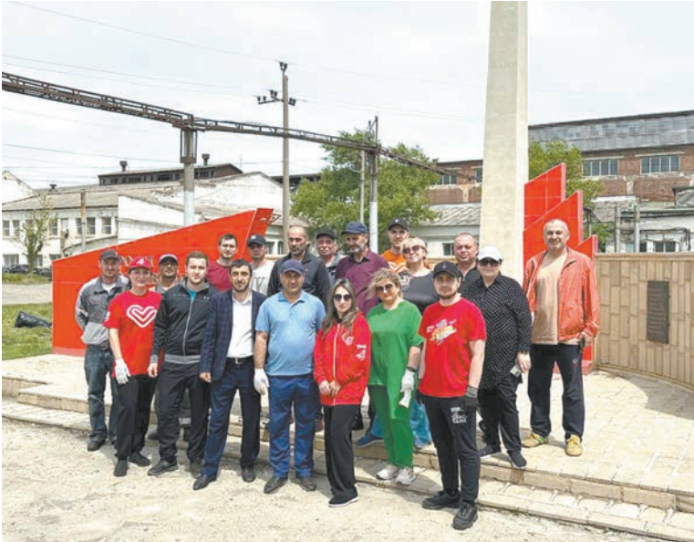
В преддверии празднования 79-й годовщины Победы в Великой Отечественной войне работники вагонного депо Махачкала организовали субботник у памятника «Героям, отдавшим жизнь за Родину»